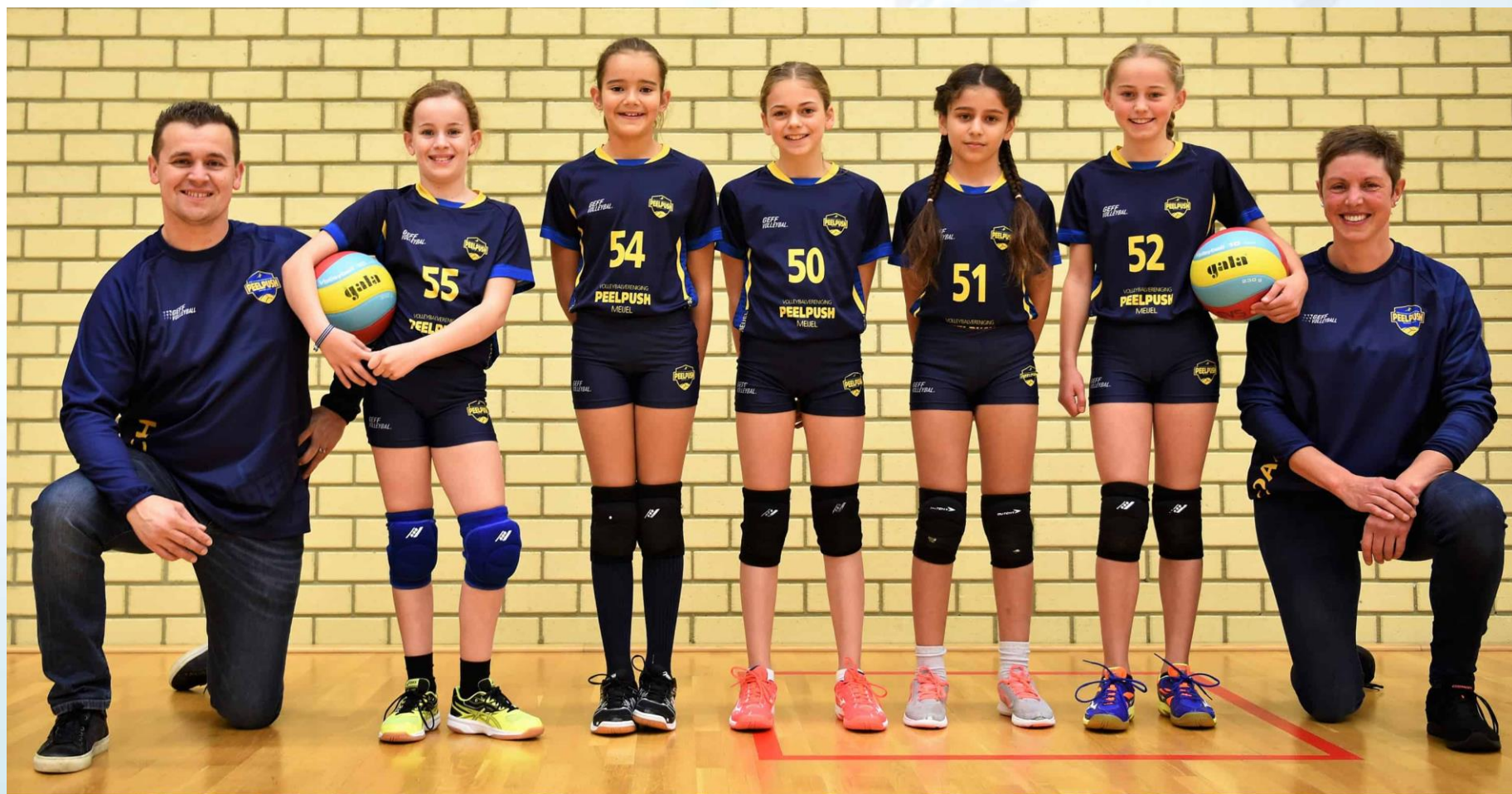
PEELPUSH N 5.3 Seizoen 2019/2020