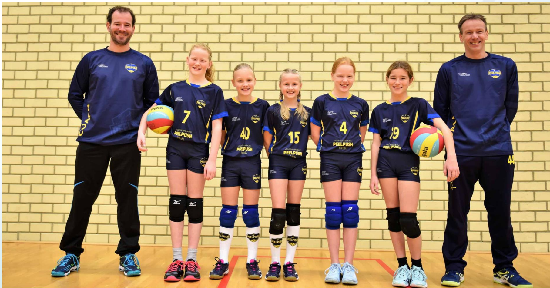
PEELPUSH N 5.1 Seizoen 2019/2020