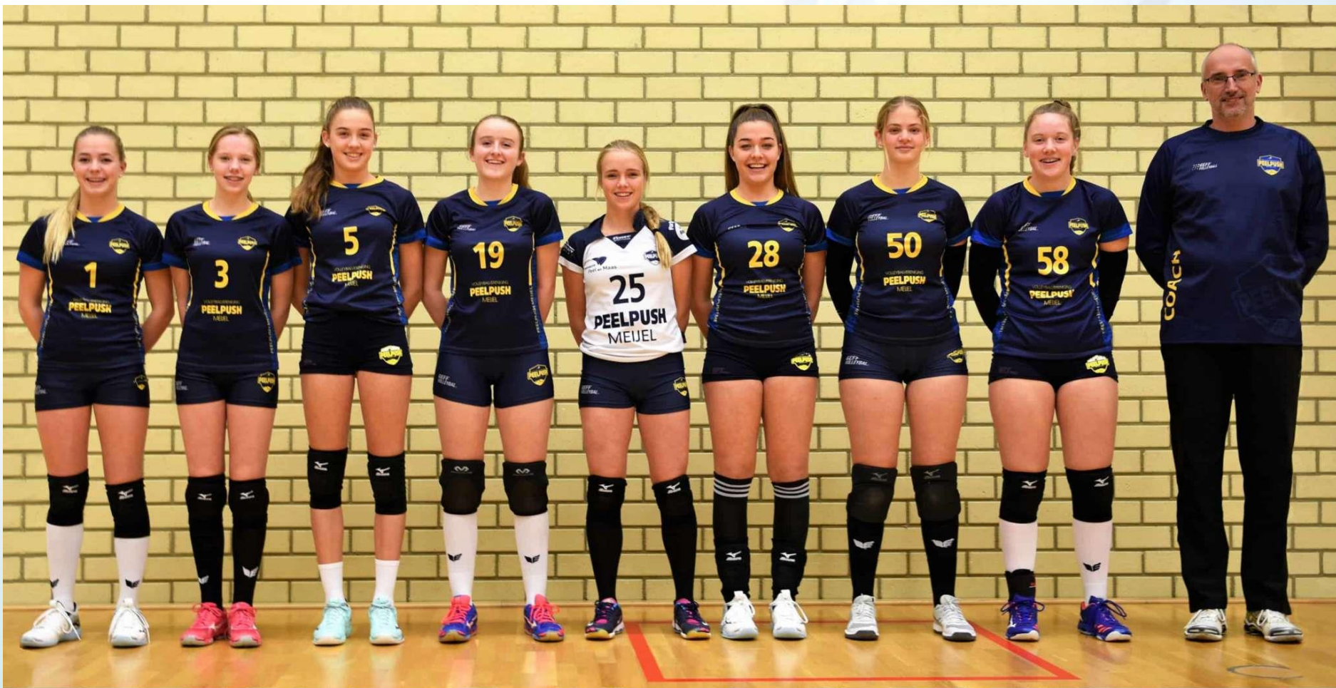
PEELPUSH Meisjes B1 Seizoen 2019/2020