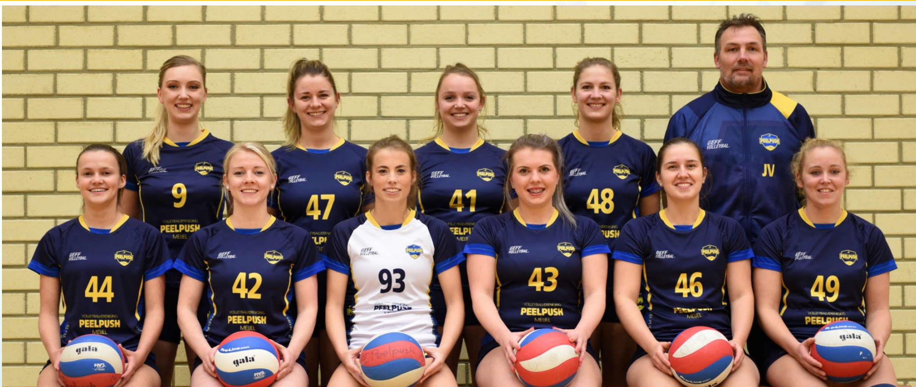
Peelpush Dames 4 Seizoen 2019 / 2020 1e Klasse E