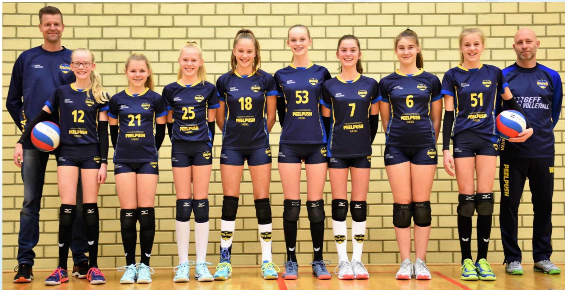
PEELPUSH Meisjes C1 Seizoen 2019/2020