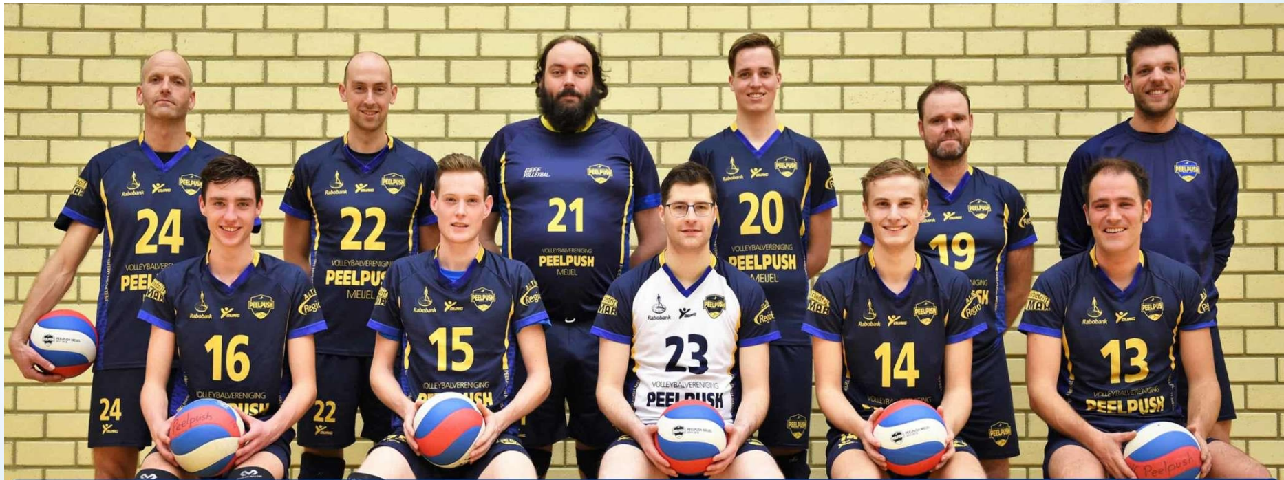
Peelpush Heren 2 Seizoen 2019 / 2020 1e Klasse E